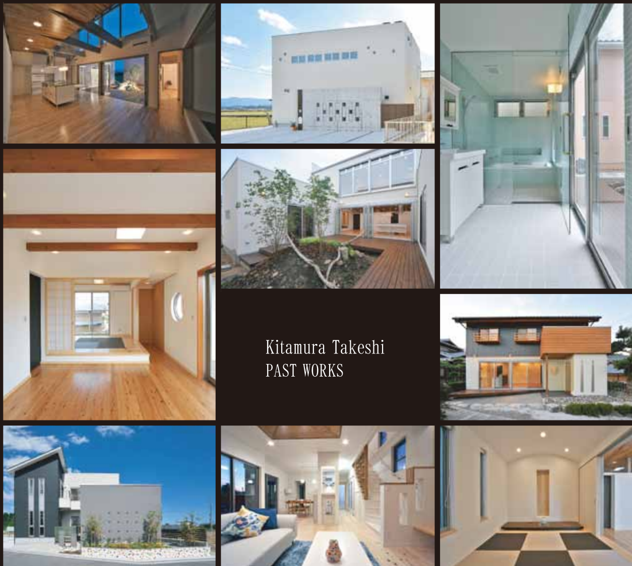
Kitamura Takeshi PAST WORKS